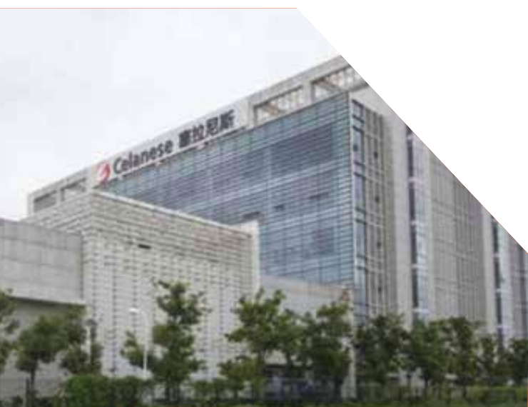
▲ 塞拉尼斯上海商务技术中心

塞拉尼斯上海商务技术中心已于2011年1月建成启用。它容纳了塞拉尼斯亚洲总部,即包括乳液等多个事业部在内的商务、应用开发实验室和研发中心。塞拉尼斯的科学家、设计工程师和技术专家在亚洲这个新的现代化机构内齐聚一堂,共谋发展。