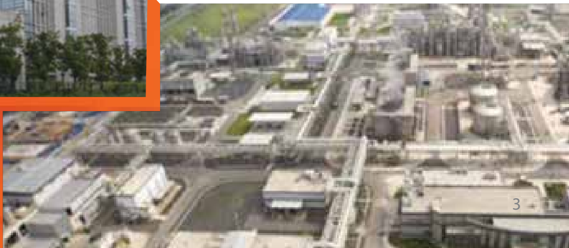
塞拉尼斯南京一体化化工基地 ▼